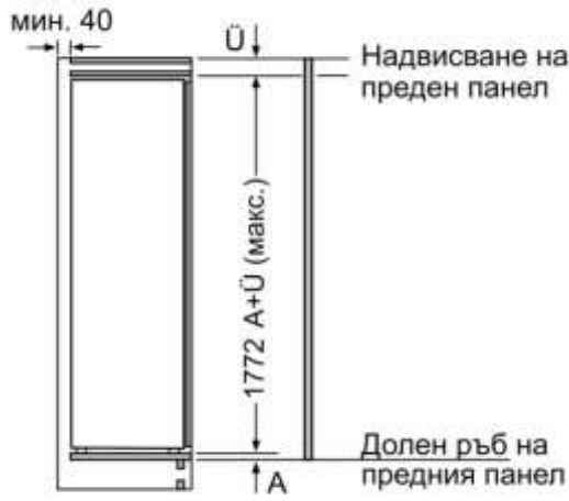
Измерване в мм

Максимално допустимо тегло на предните части на уреда