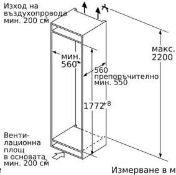
Измерване в м